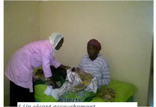
1 Un récent accouchement