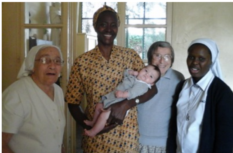
Visite aux Sœurs

+ Achat ou don de 7 ordinateurs d'occasion