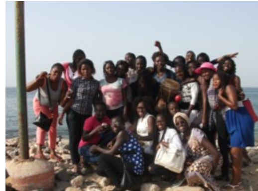
Sortie à Gorée