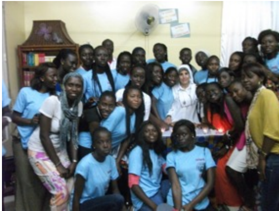
Adoration proposé le 30 juin 2016